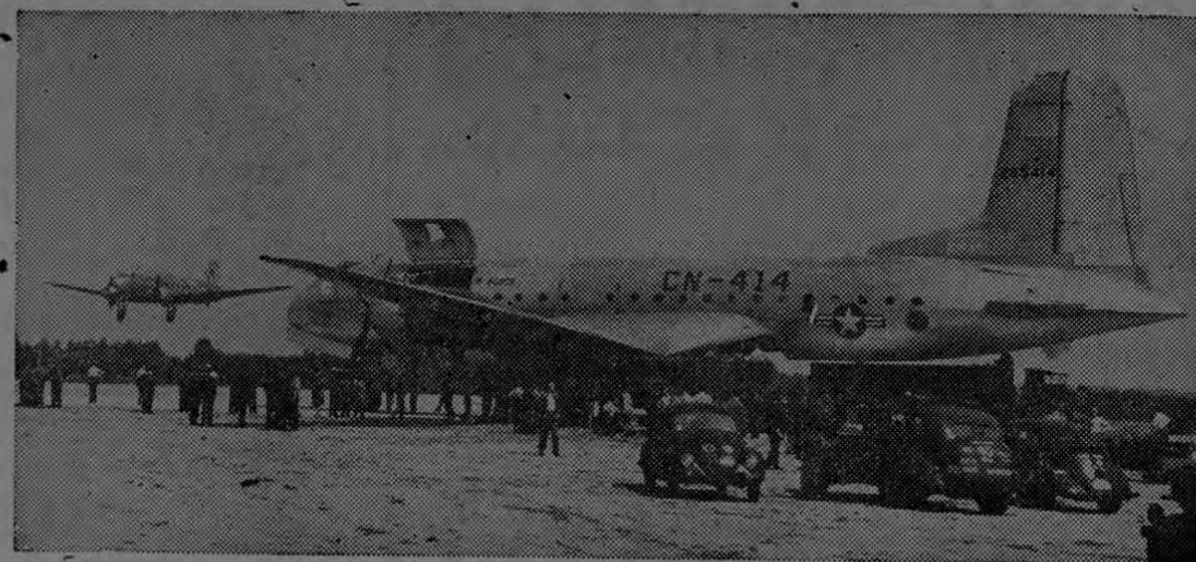
LA AVIACION AMERICANA HACE EFECTIVO EL SUMINISTRO DE ALIMENTOS A LA POBLACION ALEMANA, ROMPIENDO EL BLOQUEO DE LOS RUSOS