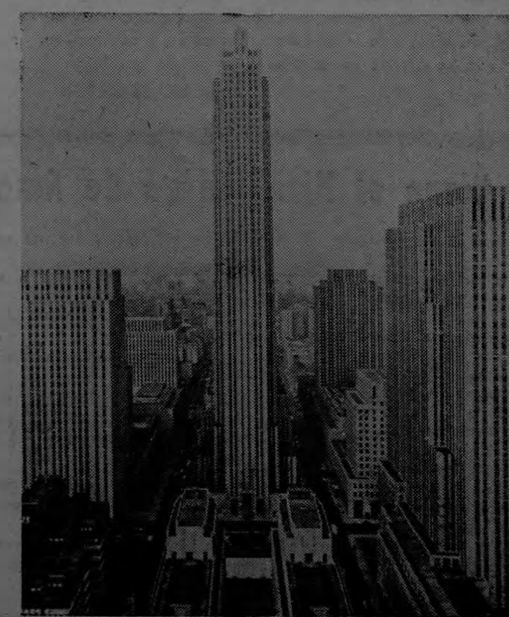
(USIS).— La presente foto nos muestra las tendencias de la arquitectura moderna en las construcciones de los grandes edificios que se levantan en los Estados Unidos de Norte América.