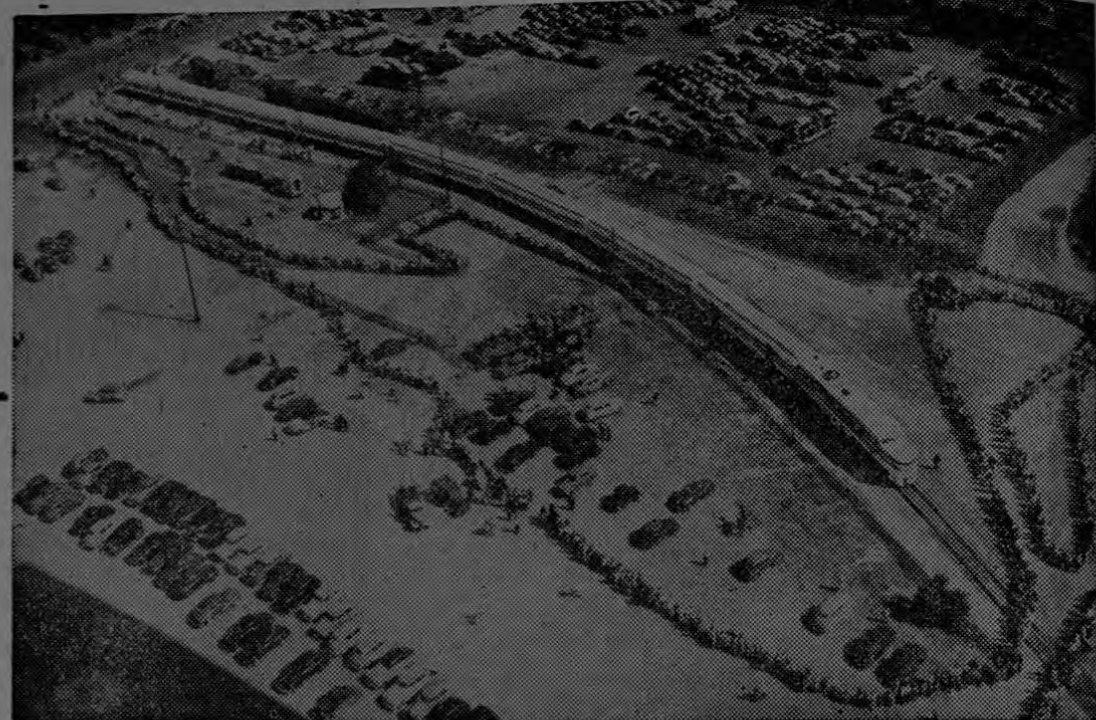
RAPIDOS TRENES CRUZAN EL CONTINENTE AMERICANO LLEVANDO EL PROGRESO Y EXTENSION CULTURAL A LOS PUEBLOS

que resulte agradable a la vista o al paladar, y la compara con su eficiente y pulcra secretaria, tanto peor para la esposa. Si la recuerda como a una per- sonita encantadora, que tuvo tiem- po de levantarse, de acomodar un poco sus cabellos, de vestir un co- queto delantal y de preparar un desayuno nutritivo en una mesa bien puesta, figura más atracti- va o hacendosa, borrará esa ima- gen de su mente. Mas separaciones conyugales co- mienzan en la mesa del desayu- no que en cualquier otro lugar, y esto deben tenerlo muy en cuen- ta las esposas.